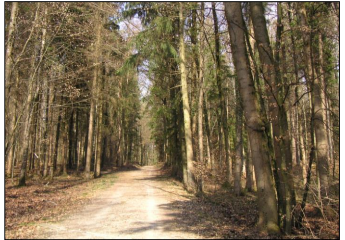
14.02.2018: Frühlingsboten am Cholfirst-Rundgang: Uhwiesen, Guggere, Stadtweg, Feuerthalen