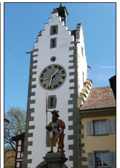
Am 11. April via Dörflingen, Panoramaweg, Gailingen ins Rest. Linde am Siegelturm, Diessenhofen