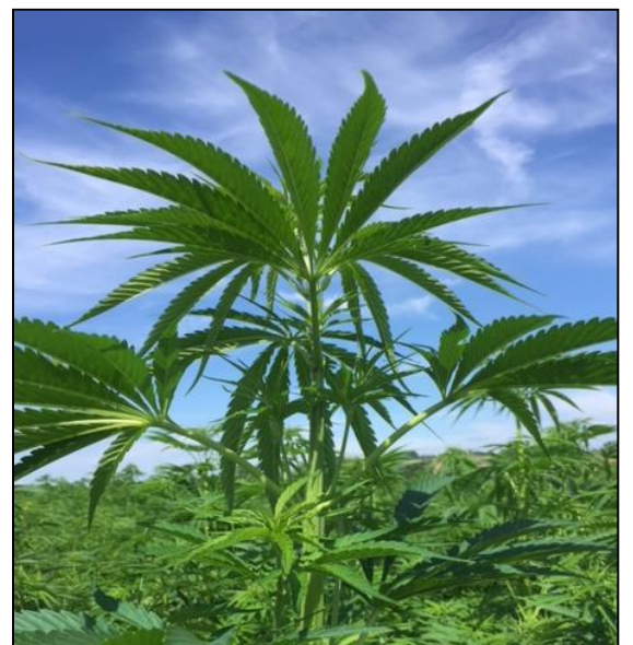
Rast am Weg vom Asperhof via Bahngleis nach Hettlingen, wo Hanffelder unser Interesse finden.