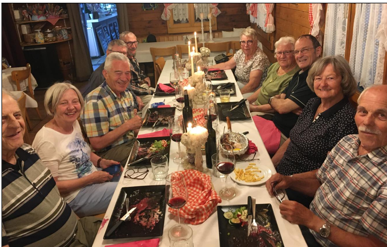
Blick in die aufgestellte Runde bei festlichem Kerzenschein am Tisch in der Gaststube.